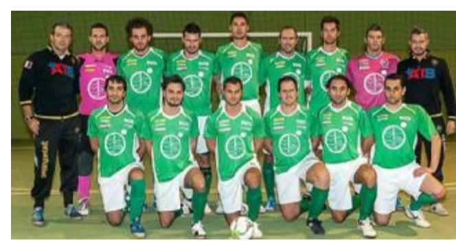
La squadra dell'Almarò Villafranca

Nel B il big match tra prima e seconda se lo aggiudica l'AgriTurismo Cà del Pea che batte la capolista Bnc Splash, si avvicina alla vetta la Crepes Oui contro Salsiza United. Quarto posto per la Lanterna Bardolino, 2-1 sulla Pizzeria Vecchia Rama, successo per Coven Uni-