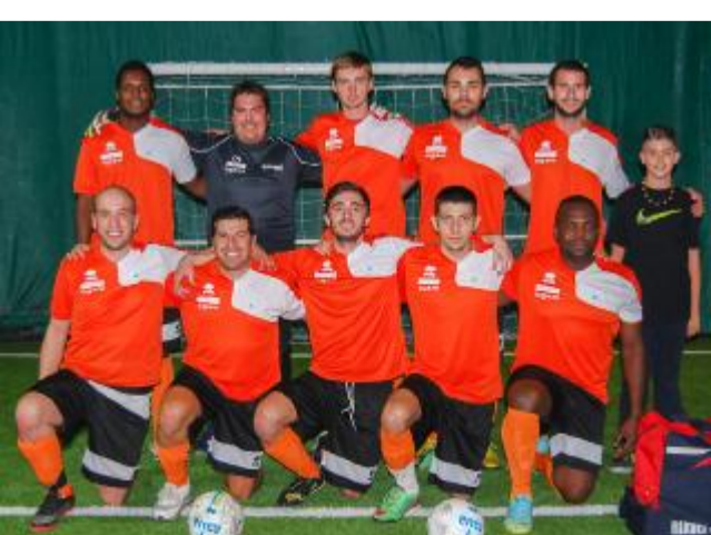
I ragazzi della Ri.Av.El. che giocano il campionato Msp

dell'Euroelectra Fantoni ora raggiunta dalla Trinacria. In quinta posizione i Green Brothers che hanno avuto la meglio sul Colletta Vigasio, sesta assieme gli Arditi sconfitti a sorpresa dalla Pizzeria Parolin Alpo. In A2 nel girone A la Longobarda è già retrocessa e 4 squadre si stanno battendo per non arrivare penultimi: il Last Proforma è in vantaggio nonostante lo 0 a 4 rimediato dal S.Lucia Team, le Riserve hanno battuto e inguaiato gli Eagles Golosine centrando anche l'accesso ai playoff, pari tra East Green Boots e Athletic Bigbabol ma