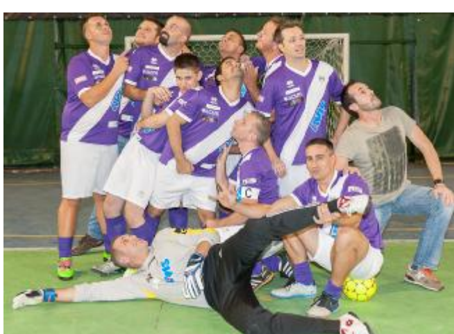
L'Avis United era tra le squadre protagonista nella scorsa stagione

Le prime quattro classificate dei playoff, la vincente dei play-out e la vincente di B parteciperanno di diritto alle finali regionali 2018 che si disputeranno dal 1 al 3 giugno 2018. Verranno premiate le prime otto squadre classificate, il capocannoniere del cam-