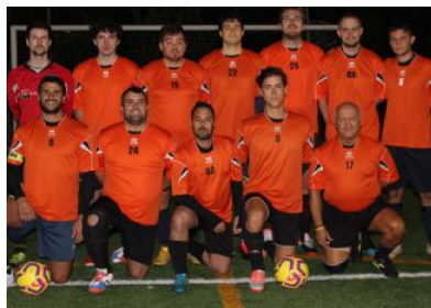
La formazione del Due Fisso

Con la seconda giornata già in archivio sono due le squadre al comando, entrambe a punteggio pieno: il Bottagisio